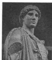
IMAGEN DE CUBIERTA Atenea Lemnia , copia del Museo de Arqueología Clásica Juan Miguel Dihigo de la Universidad de La Habana.